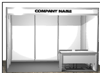
Gambar 3.2 Stand Standard